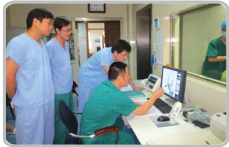
神经介入团队正在讨论手术方案。