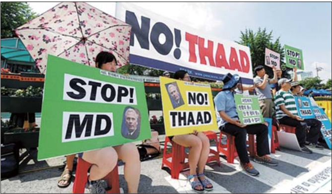
抗议者在首尔韩国国防部前抗议美国在韩部署萨德系统。