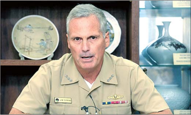
11日，叙林在韩国国防部对媒体记者发表讲话。

美国导弹防御局局长詹姆斯·叙林 11日在韩国联合参谋本部与韩军高层人士会晤，磋商末段高空区域防御系统(即“萨德”系统)部署事宜。他表示，“萨德”反导系统拦截率为100%，将部署到韩国的“萨德”系统并不会被纳入美国的全球导弹防御系统，且不会针对中国。