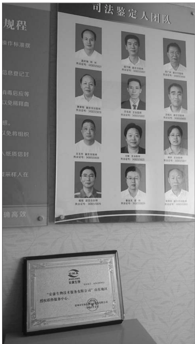
根据天桥区这家鉴定机构的牌匾,其业务范围不含亲子鉴定。

在济南,每年会进行约两千例亲子鉴定,其中相当一部分是为解决落户问题。不过,随着亲子鉴定数量的激增,形形色色的鉴定机构也开始分占一杯羹,亲子鉴定市场鱼龙混杂,有的鉴定所号称几滴口腔黏液不需任何证明材料就能做。不过,司法部门说,济南有资质的亲子鉴定机构仅有5家,大多数没有资质的机构属非法。