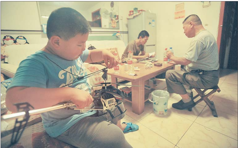
还未懂事的孩子不知道家庭的变故,父亲却满脸惆怅。