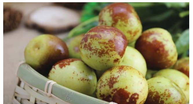
正宗沾化冬枣个大皮薄，赭红光亮，肉脆细嫩，甘甜无渣

很小。而普通红枣都有些许渣子的感觉，吃起来有些皮，有些伪劣冬枣甚至有受潮的爆米花的感觉。