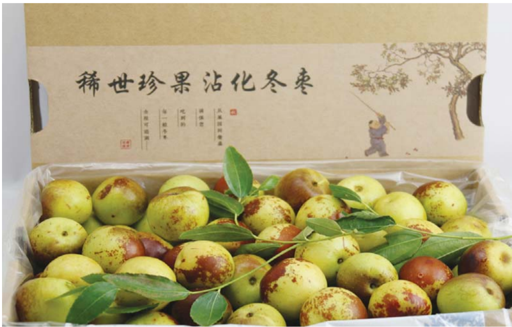
码帮精选直供沾化原产地冬枣