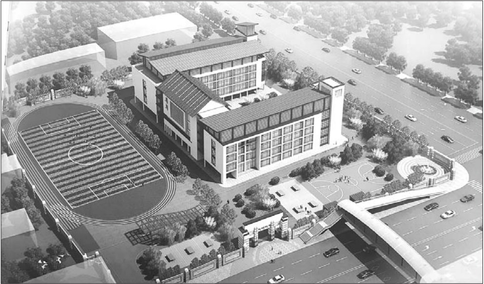
新规划的济宁八中南校区鸟瞰图。

本着适度超前的原则,济宁按照市域统筹、以县为主、一县一策的灵活方式,确定城区中小学新建、改扩建计划。借鉴国内外的先进理念和经