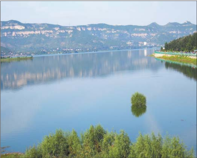
8月底9月初,济南南部山区大小水库都已蓄满水。本报记者 周青先 摄