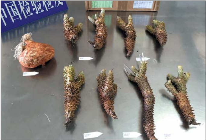
济南邮政口岸截获的无正式中文名多肉植物。

这种还没有正式中文名称的种苗,既无检疫审批手续,也未经生物安全风险评估和检疫,危害我国生物安全和生态安全的风险不明,经邮寄闯关入境很可能携带危害我国生物安全和生态安全植物病虫害,甚至植物种苗本身也可能就是有害生态安全的外来入侵物种。因此检验检疫部门提醒,要学习掌握国家的法律法规,不要在网上直接从国外购买植物苗木在内的禁止携带邮寄物入境,以免给自己带来不必要的经济损失和必须承担的法律