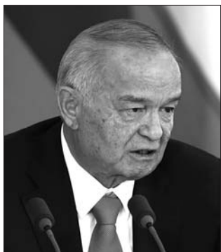
2016年4月26日,在俄罗斯首都莫斯科拍摄的卡里莫夫的资料照片。

得到91.9%的选票成功连任。美国批评选举“既不自由,也不公平”。2002年卡里莫夫通过公投把总统任期由5年延长至7年,