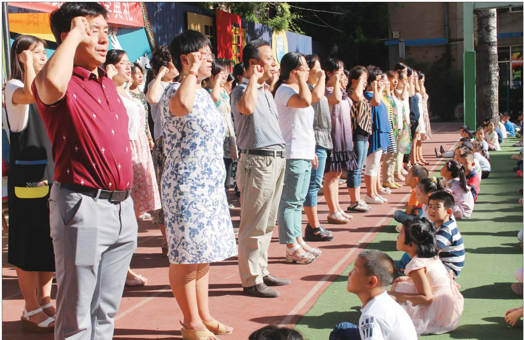
济南市纬二路小学的全体老师在开学典礼上,面向全体学生宣誓,立德树人,为人师表。