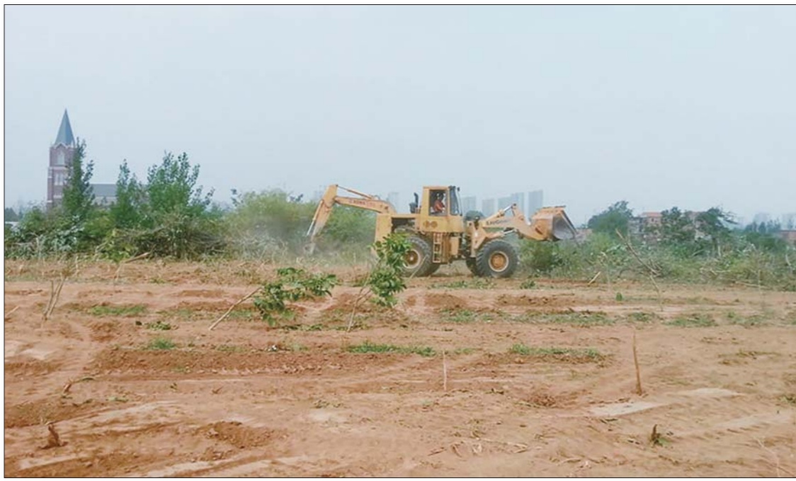
近300棵核桃树被毁后,现场成了一片空地。