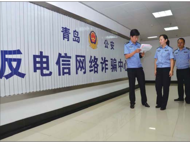
9日，青岛市反电诈中心正式运行。

岛，面向山东省东部地区，全面掌握发案形势和规律特点。在省反电诈中心领导指挥下，青岛、淄博、东营、烟台、潍坊、威海、日照、临沂八市公安机关派出专职民警在反电诈中心轮值，开展研判打击工作，对接报的涉案资金流、信息流和人员流进行比对研判，推送办案单位进行个案侦查打击；加强案件串并、侦查经营，为“查找犯罪窝点、确定作案成员、形成证据链条、实现集约式打击”提供有力支撑。