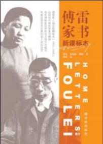
译林出版社 2016 年版,新课标本