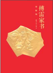
译林出版社 2016 年版,傅雷夫妇逝世 50 周年纪念版

今年是傅雷去世五十周年,也是《傅雷家书》出版三十五周年。对于“文革”后出生的人来说,大多数读者是通过家书认识傅雷,甚至把“书信家傅雷”置于“翻译家傅雷”之上。随着傅聪回信的失而复得、傅雷家书手稿的进一步发现和整理,译林出版社推出了目前最为完整的《傅雷家书》。在近日举办的新版《傅雷家书》读书会上,学者陈子善、陈思和及版权代理人江奇勇从不同的观察角度与阅读体验,一一讲述了这部著名的“家书”背后的亲情故事、文化探讨与时代价值。