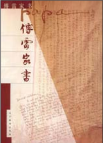
辽宁教育出版社 2003 年版