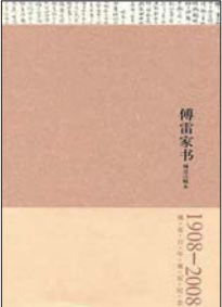
天津社会科学院出版社 2008 年版,毛边本,傅雷诞辰百年纪念版