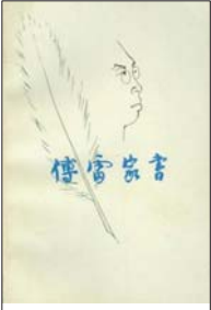
生活·读书·新知三联书店 1981 年版,《傅雷家书》第一版