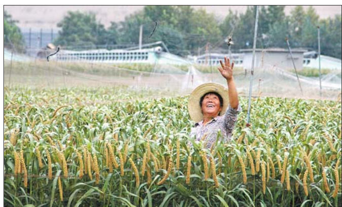
◀ 二等奖 作者 金永生