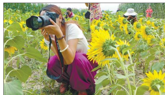
▲不少作物新品种吸引了学员们的目光。