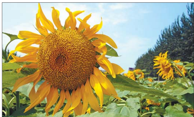
◀ 二等奖 作者 任婷婷