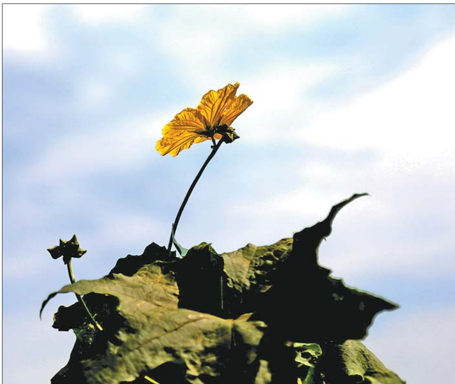
▲一等奖 作者 杜海燕