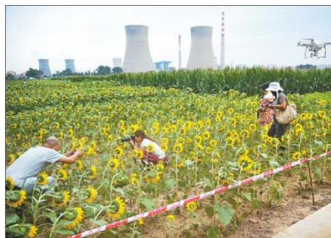
▲相机、手机、无人机齐上阵。