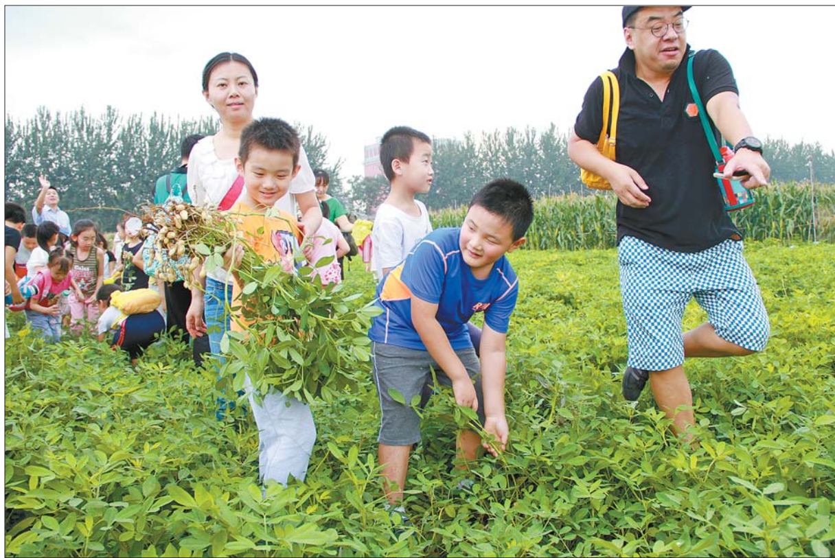
▲一等奖 作者 刘佳