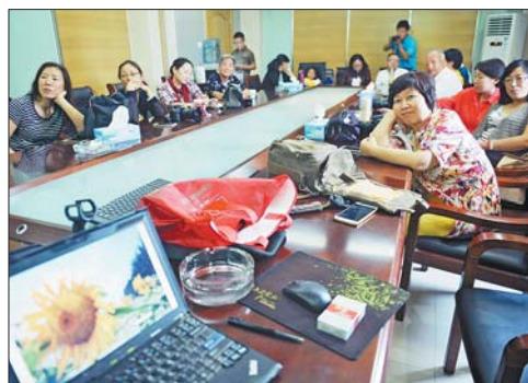
▲拍完片,在一起品评一下作品,总结拍摄中的得失。 本报记者 戴伟 摄