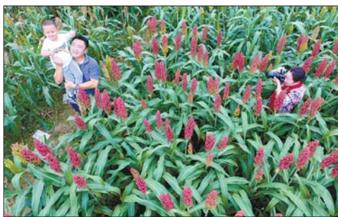
▲近距离接触这些熟悉又陌生的农作物,也学到不少农业科技知识。 本报记者 刘军 摄