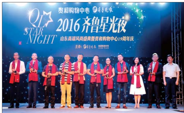
“齐鲁风尚人物”合影。