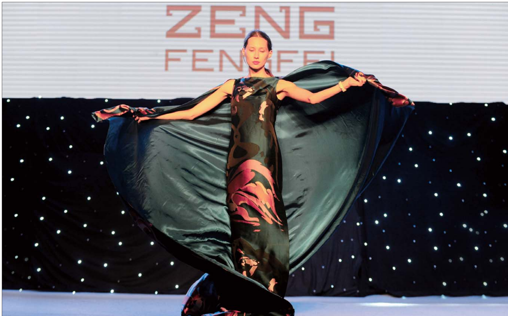
模特演绎著名设计师曾凤飞作品。