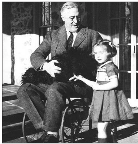
坐在轮椅上的罗斯福。