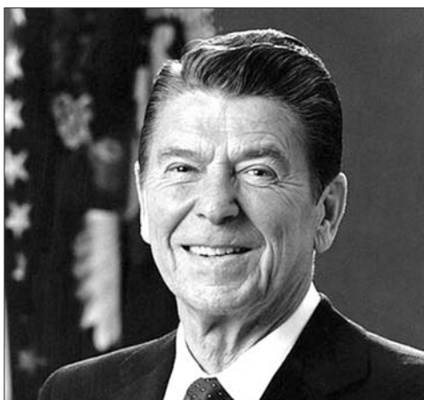
高龄当选美国总统的里根。