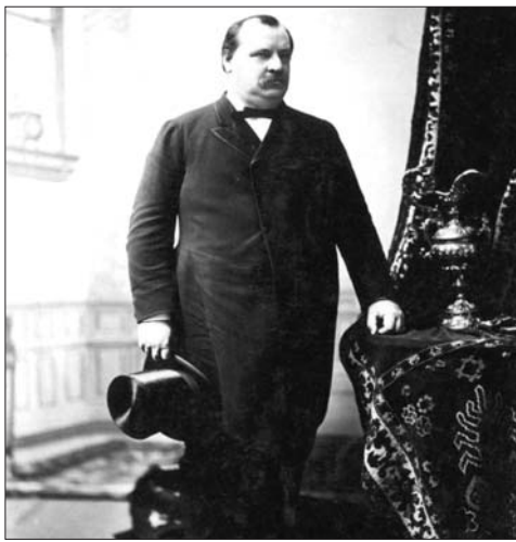
美国第22、24任总统克利夫兰。