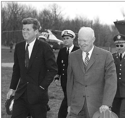
艾森豪威尔(右)和肯尼迪(左)在一起。

他们二人是美国总统选举历史上年龄最大的一对竞争对手。此前,最高龄的总统当选者为里根,他1981年上任时还有十多天就满70岁。查阅美国历任总统的健康档案,带病上岗、隐瞒病情、病而不报、病而不医的情况让人咋舌,在任内因病去世的总统也有4人。