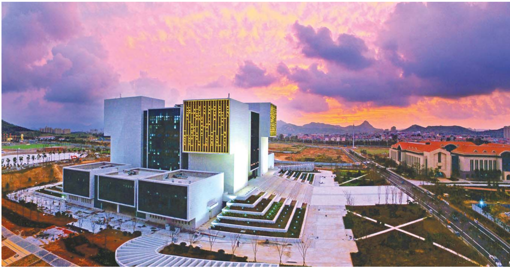
▲晚霞中的博物馆,博物馆四面亮灯的“竹筒”是孙子兵法。