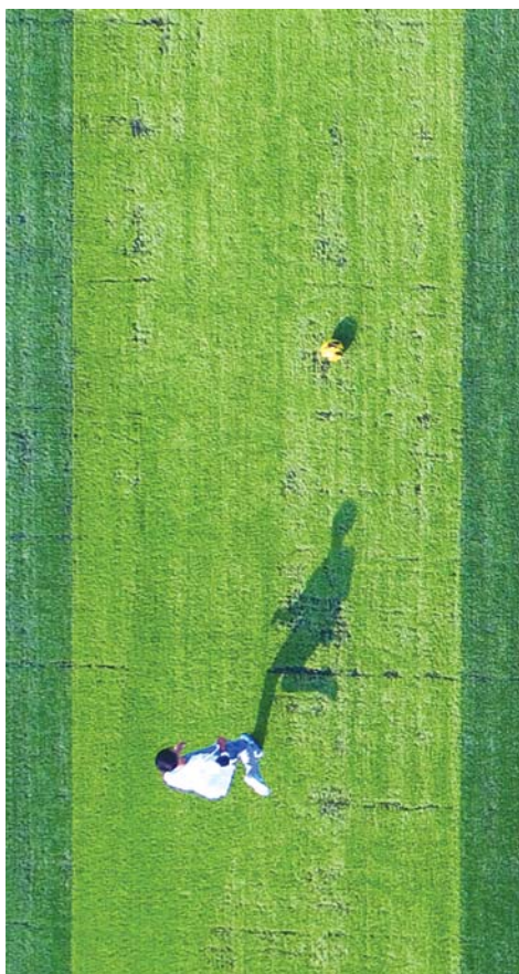
▲已报到的新生忍不住在新球场上试试脚法。 ▶海边晚霞衬着火辉煌的校园,魅力一箩筐。