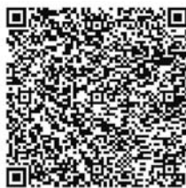
扫描二维码可查询具体线路调整

同时,自2016年9月19日起,受第三阶段封闭施工影响的7路、23路、43路路共3条线将恢复西炮台南路与建设路之间路段的运行。