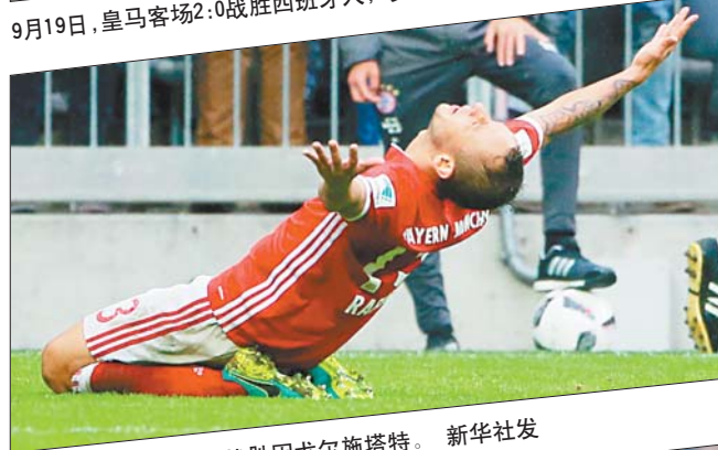
9月17日,拜仁主场3:1战胜因戈尔施塔特。