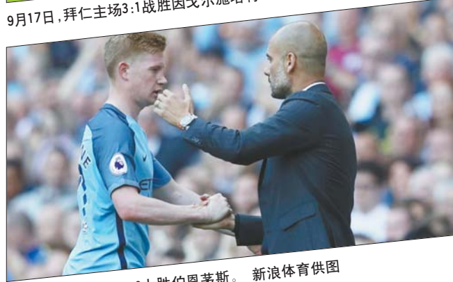
9月17日,曼城主场4:0大胜伯恩茅斯。