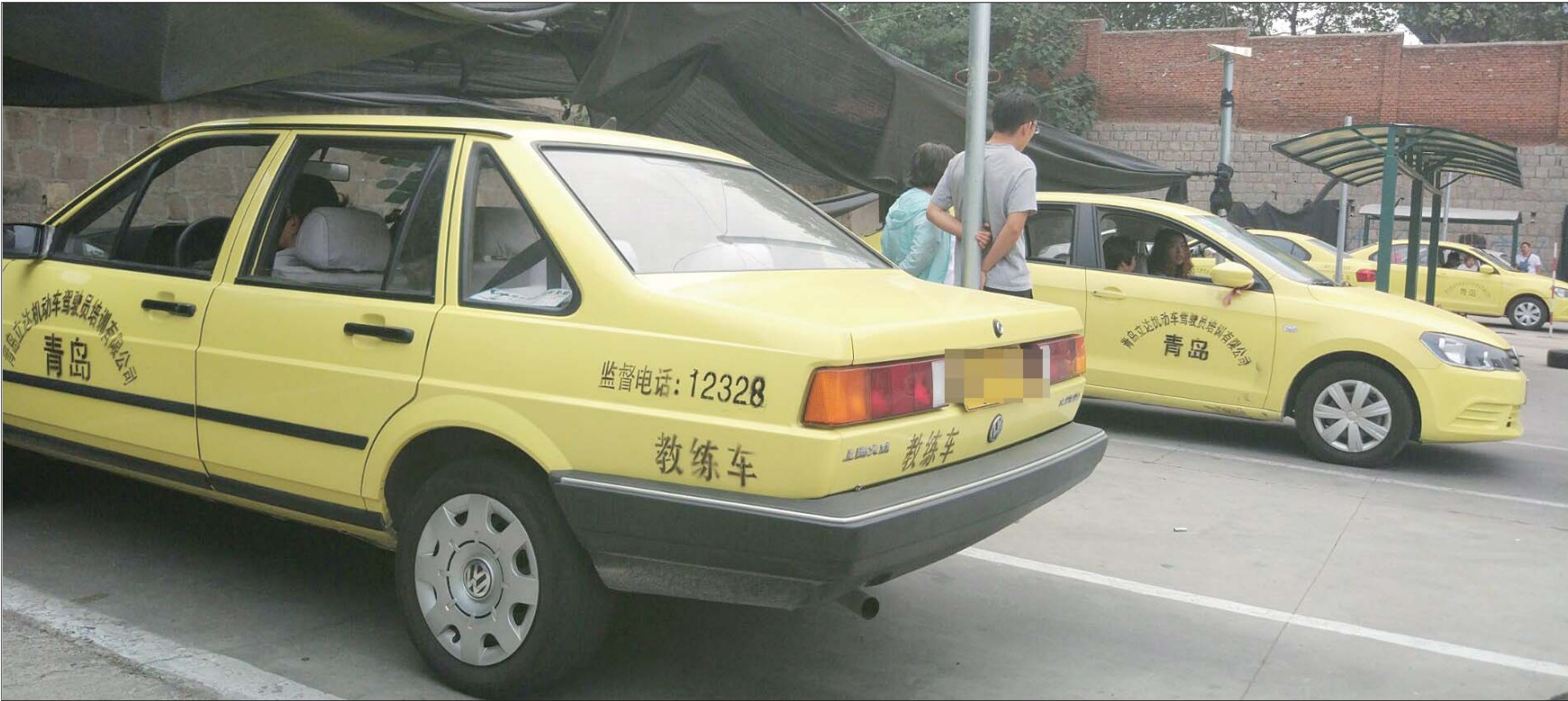
由于驾校学员数量的减少,以前十来个人共用的教练车,现在变成三四个人共用。

原来汹涌澎湃的学员大军现在怎么不见了?究竟是什么原因导致了驾校学员数量的骤减?对此,业内人士分析,一方面,目前在济青两地,学车人员的刚性需求已经大幅度减少;另一方面,驾校的总体规模和教练车数量又超出实际需求,这才造成了“僧少粥多”的局面。