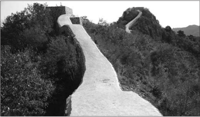
网传的长城被“抹平图”。

据其透露,此次修缮属于抢险工程,由于部分地段的长城有险情,游客肆意蹬踏,雨水大的时候顺着墙体流下,长城