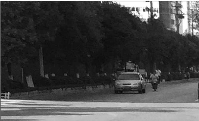
在部分路段,机动车和非机动车经常混行。

22日无车日,绿色出行再次成为人们的口头禅。正当全社会倡导绿色出行时,部分司机的不文明驾驶行为却成为绿色出行的“拦路虎”,非机动车道上随意停车、非机动车道上逆向行驶、机动车和非机动车抢道,这些不文明驾驶行为一直影响着居民绿色出行的念头。不摒弃这些陋习,仅仅依靠这一天不开车倡导绿色出行似乎单簿些。