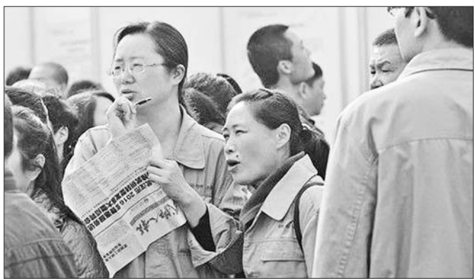
穿着武钢工作服的下岗工人在招聘会上求职。(资料片)

●下一步, 国家相关部门还会在实施公有制多元化股权改革的同时, 积极稳妥地推进混合所有制改革, 着力解决国企不愿意混, 民企难以混的问题。