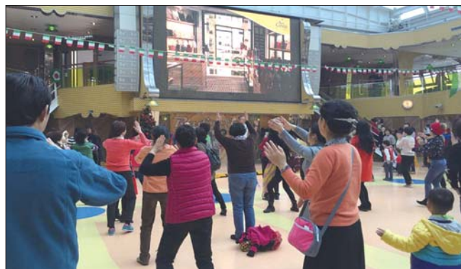
豪华邮轮上中国大妈跳广场舞。(资料片)

近年来,各大国际邮轮公司纷纷进军中国。早在2006年,歌诗达开启以中国为母港运营的国际邮轮航线,成为首家进驻中国的国际邮轮公司。从去年开始,歌诗达邮轮加大了向内地二三线城市的渗透。2015年,歌诗达中国出发母港航次共168个,