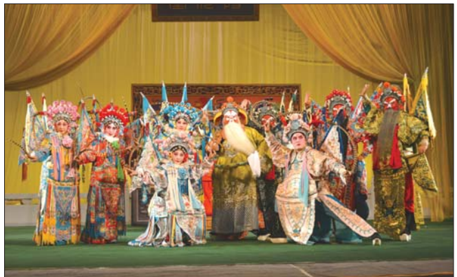
国家级非物质文化遗产 山东梆子 ▲