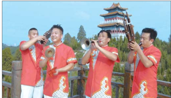
国家级非物质文化遗产 鲁西南鼓吹乐 ▲