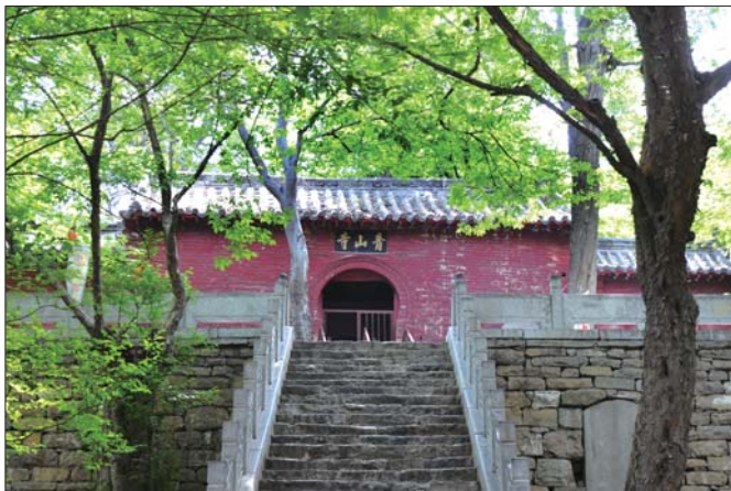
全国重点文物保护单位、国家AAA级旅游景区 青山寺 ▲