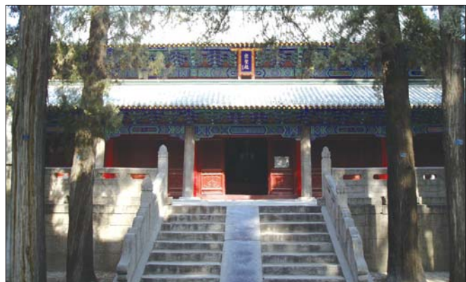
全国重点文物保护单位、国家AAA级旅游景区 曾庙 ▲

以武氏祠—青山—曾庙风景区、九顶山中国养生城、中华孝道文化园为龙头,推进曾子文化向旅游产品开发、休闲养生、修学旅游、文化体验等产业拓展转化,打造曾子孝道文化商圈;深度发掘民间特色文化资源,规划建设工艺品交易市场、民俗展示街区,多层次体现城市文化古韵和时尚新姿,打造民间特色文化商圈。