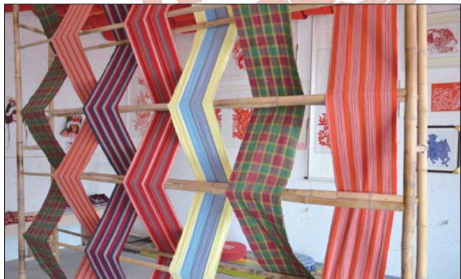
国家级非物质文化遗产 鲁锦织造技艺 ▲