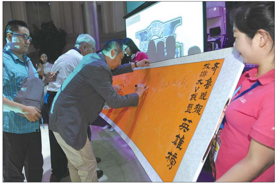
登上邮轮的大V代表和会员企业负责人一起,在齐鲁晚报旅游大V联盟“英雄榜”上写下自己的名字。