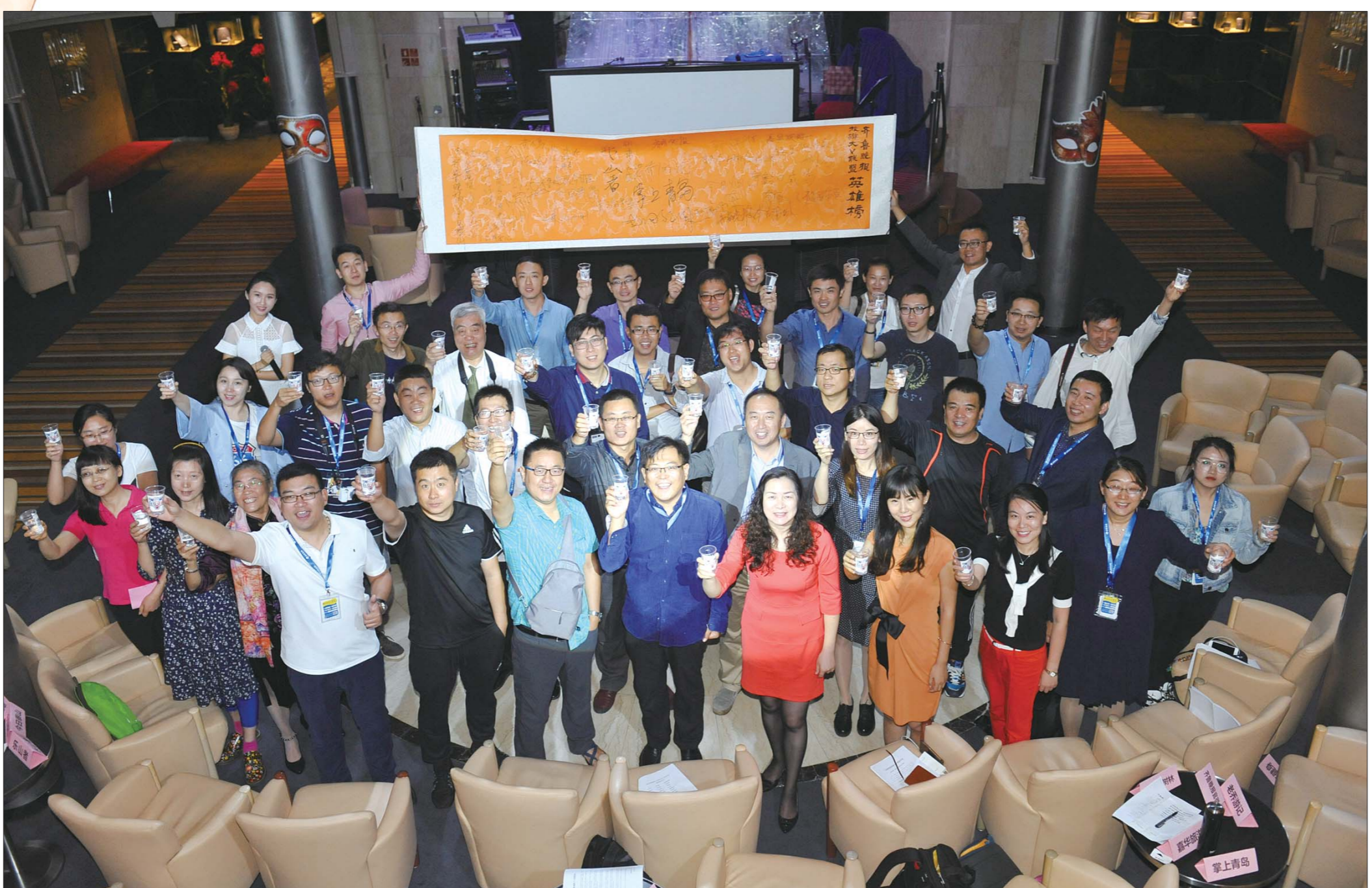
齐鲁晚报旅游大V联盟结盟盛典现场,本报记者 徐延春 摄

盟的日常办事机构秘书处设在齐鲁晚报旅游工作室,今后将负责协调盟内各项工作。 会上通过“盟约”,明确盟员的义务,盟员之间相互配合,努力做到同频共振;今后联盟计划定期发布盟员社会影响力排名,并将结果向全国旅游机构、企业等推介;联盟确定《齐鲁晚报·旅游休闲》周刊作为盟员日常活动平面展示平台,“老乔游记”公众号为网络宣传平台。 结盟仪式也别出心裁,40余人登上邮轮的盟员分批上台,在“英雄榜”上郑重地签下所代表微信公众号的名字,之后共饮“结盟酒”。 齐鲁晚报大V联盟成立后的首个旅游营销论坛,也随后在高大上的歌诗达·维多利亚号邮轮上举行,本期题目是“邮轮和大V力量”。论坛结束后,齐鲁晚报旅游大V联盟首批56家盟员共同发布了“共识”。 以微信、微博、客户端等为代表的新媒体、自媒体、微媒体兴起于最近五年,如今已经成为一股足以影响业界和消费者的新兴力量。以前,旅游微媒体各自为战,在“野蛮生长”的同时,也遇到种种瓶颈和限制。齐鲁晚报牵头成立旅游大V联盟后,将擦亮一个旅游自媒体矩阵品牌,有利于推进行业自律,也为旅游业界、旅游自媒体、旅游者、涉旅相关行业及业态沟通、交流、合作,搭建起一个良好平台,今后必将对山东乃至全国的旅游业界产生深远的影响。