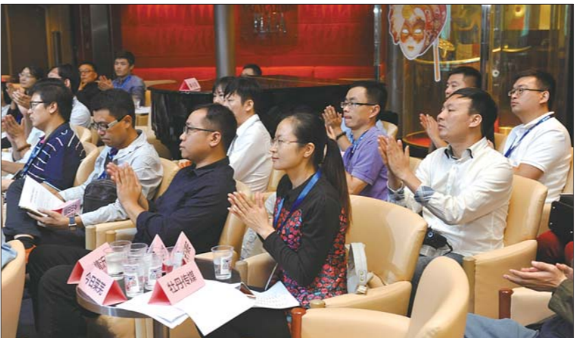
致辞和论坛演讲嘉宾讲得精彩,大V们掌声不断,本报记者 徐延春 摄

世界无时无刻不是在变化的,传媒和旅游作为前沿的两个行业,亦是如此。 面对愈加挑剔和需求升级的用户,大家都在努力求变,努力迎合需求,纸媒向融媒体转变,旅游企业也开始集合更全的要素,提供给游客。 首先,这依然是内容为王的时代,我们要不断加强制造和整合优秀内容的的能力,专业的文字和图片,专业的整合,随之传播给庞大的新媒体用户并进行扩散。 其次,将更多旅游亮点充分展现出来,针对游客需求量身定制产品和内容。新媒体的传播离不开针对性的产品,只有迎合了需求,才能引起用户的关注。这需要旅游企业提供更适合市场的旅游产品,而新媒体提供更优质的推荐的内容和渠道。 可以说,无论是媒体还是旅游企业,都应该求变、求合作、求发展,让专业的人做好专业的事,携手从这个变化的世界中实现共赢。这一切的出发点是:顺应需求,精益求精,量身定制,完善服务。