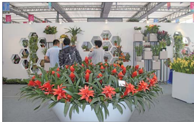
发现喜欢的花,赶紧去看看。