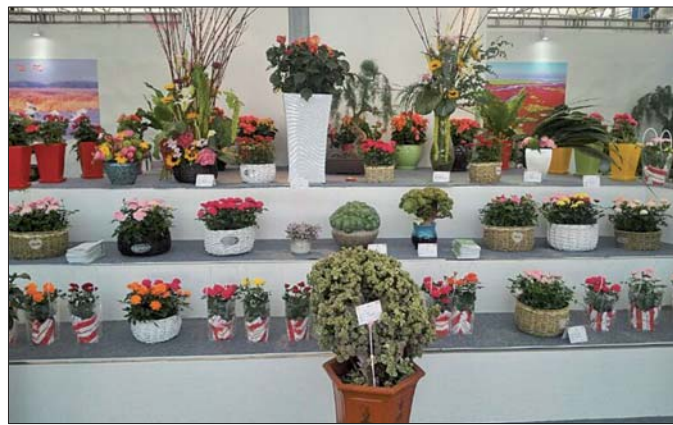
各式各样的小盆栽、小盆景,颇受游客喜爱。

然,在商河还有一场味觉盛宴等着你,老豆腐、豆腐皮、糖酥火烧、商河烧鸡等地方特色美食自然不用说,花博会期间,魁王金丝小枣、李桂芬御果贡梨、中华圣桃等三大采摘节活动也会相继上演,定能让你领略到生态商河的乡村乐趣。有吃的、有喝的、有玩的,这个假期,商河会让你不虚此行。亲,我们在商河等你呦!