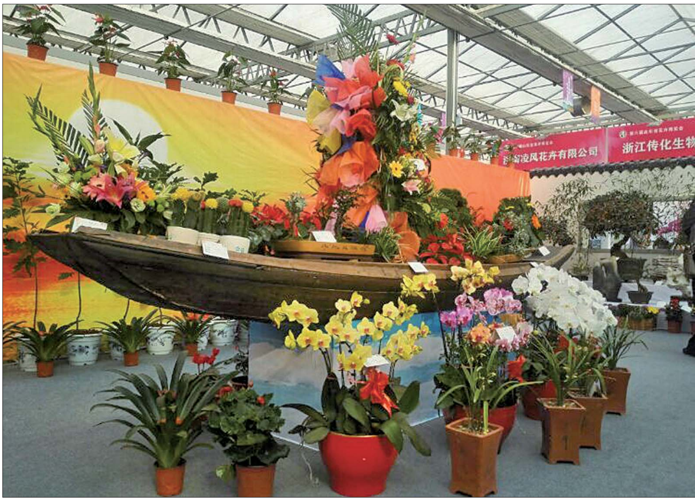
商河像一艘种满鲜花的巨轮,准备扬帆起航。