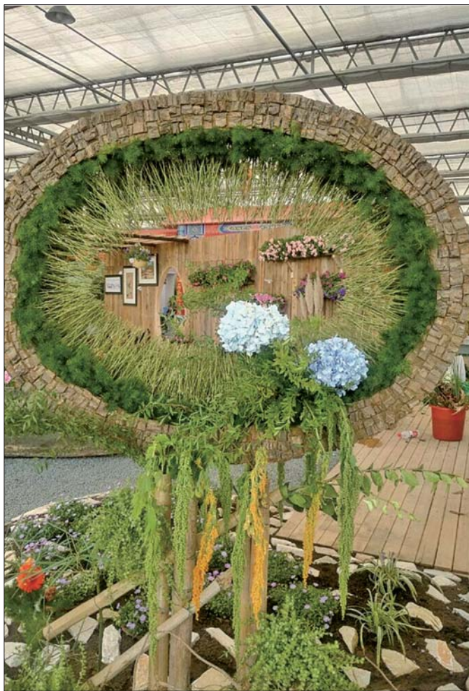
会场上各种鲜花的造型,让人百看不厌。

子秧歌的身影,在秧歌古村孙集镇袁窰村,你不仅可以欣赏到原汁原味的鼓子秧歌,还可以穿越在秧歌的千年历史里,在古村中看到鼓子秧歌的演变与传承。看完喧闹的秧歌,“泡汤”将是你放松身心的不错选择,温泉基地、蓝湖温泉、瑞阳温泉、温泉农庄等汤池景区各具特色,高端的、商务的、家庭式的、酒店式的,总有一款适合你。当