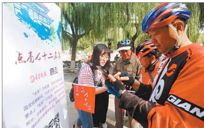
寻泉勇士关注齐鲁壹点APP。

活动中,济南十大泉群72名泉已经被全部点亮,其中点亮次数最多的仍是市区泉水分布集中的黑虎泉泉群、趵突泉泉群、五龙潭泉群。虽然位置偏远且寻找难度较大,但是趵突泉泉群、洪范池泉群等郊野泉