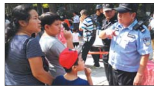
天天“逛”景区 羡慕他人“全家乐” B03 最抢眼