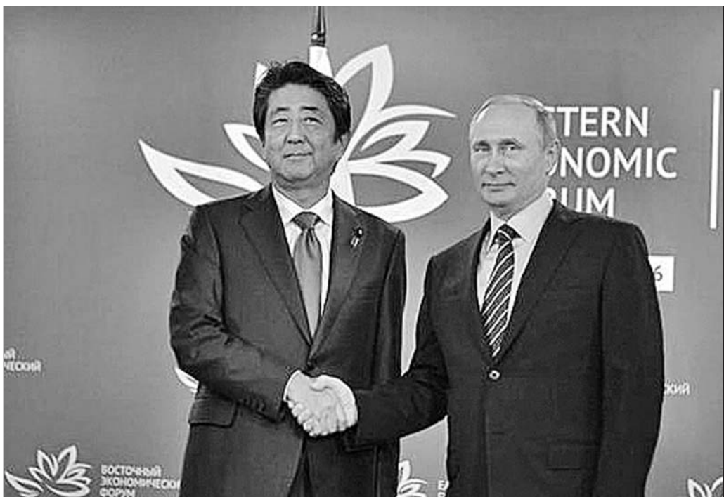
9月2日,在俄罗斯符拉迪沃斯托克东方经济论坛上,俄罗斯总统普京与日本首相安倍晋三握手。