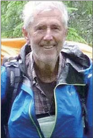
挪威地球物理学家比约恩·哈森