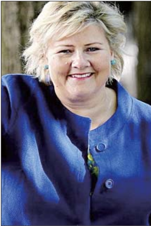
挪威首相埃尔娜·索尔贝格