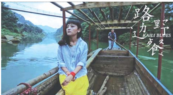
今年上映的文艺片《路边野餐》获得业内一致好评

自己的个性,努力与大众审美接壤,这也势必会给导演的创作激情降温。如果一位导演拥有了外部环境给予的“创作自由”承诺,他们就会尽最大可能地释放自己的个性与激情,创造出伟大的电影。昆汀和伍迪·艾伦就是具有代表性的例子,他们的电影的特色之一就是维护了自己创作时的任性,他们才不会管一部分观众会不会理解透,他们最大的创作态度就是,自己拍高兴了,观众才会看得高兴。