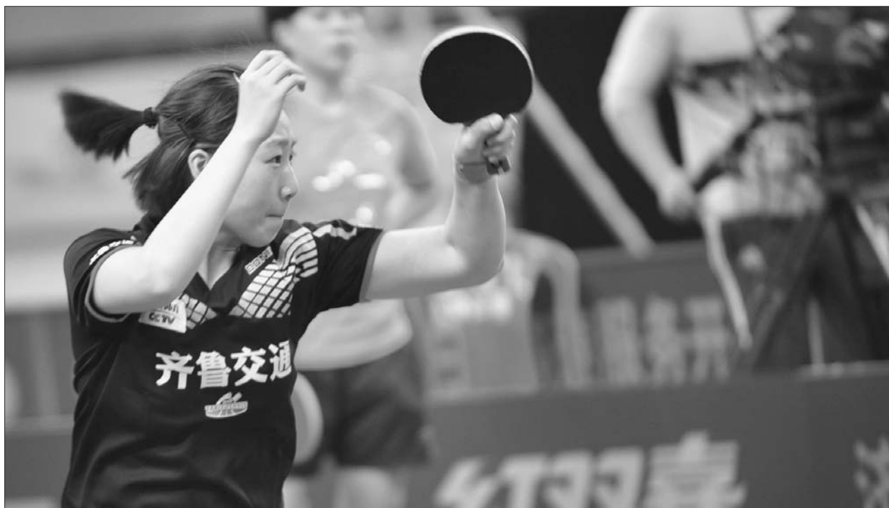
10月19日晚,本赛季乒超新军齐鲁交通俱乐部首次主场亮相,在济南奥体中心以3:2击败对手,许多热情球迷到场助威。

以里皮的身价,光靠中国足协恐怕真是负担不起他的年薪。要是恒大出资,会不会有额外的条款,比如请里皮身兼两职,既担任中国队的主帅,也当广州恒大的教练,真相到底如何,即将水落石出。