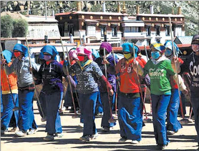
藏族人民正在打阿嘎。

我希望有个如你一般的人 如这山间清晨一般明亮清爽的人 如奔赴古城道路上阳光一般的人 温暖而不炙热，覆盖我所有肌肤