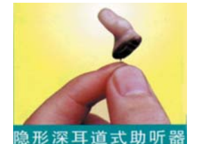
隐形深耳道式助听器

闽食药监械(准)字2013第2460059号 闽医械广审(文)第2015040006号