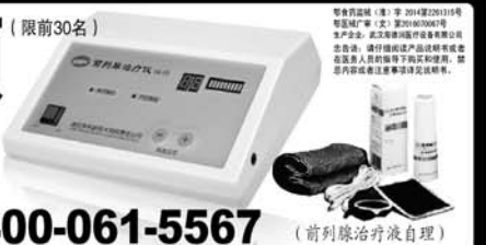
(前列腺治疗仪自理)