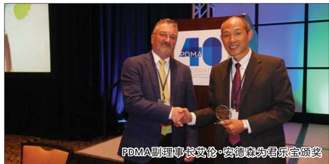
PDMA副理事长艾伦·安德森为君乐宝颁奖

君乐宝婴幼儿配方奶粉的成功获奖,秘诀在于君乐宝依托其创建的“4+1”世界级优质奶粉公式,致力于做全球最优质的顶级奶粉。正是因为对产品质量的更高标准和精益求精,君乐宝奶粉今年8月经过多达二百多项严苛检测正式进入香港市场销售,产品品质、配方、价格与内地销售的完全一致,真正实现“同质同