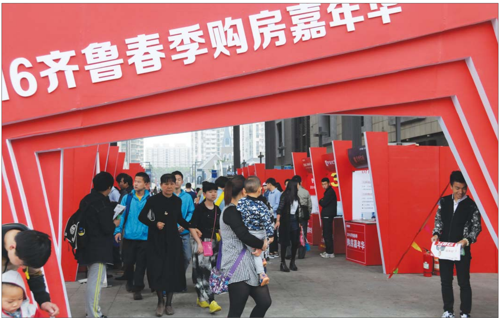
2016齐鲁春季购房嘉年华现场吸引了众多准购房者

据悉,2016齐鲁秋季购房嘉年华将于本周末在经四路万达广场与市民见面,区别于春季,此次主办方将嘉年华地点移至万达广场室内一楼西广场处,真正做到边逛街边看房,让购房者享受一站式轻松看房体验。此次嘉年华现场,购房者除了可以在现场看到多物业类型的房产以外,周末两天,记者还将在整点与购房者进行互动游戏,凡参与互动的市民均有机会获得品牌电火锅、小米手环、花生油等精美礼品。