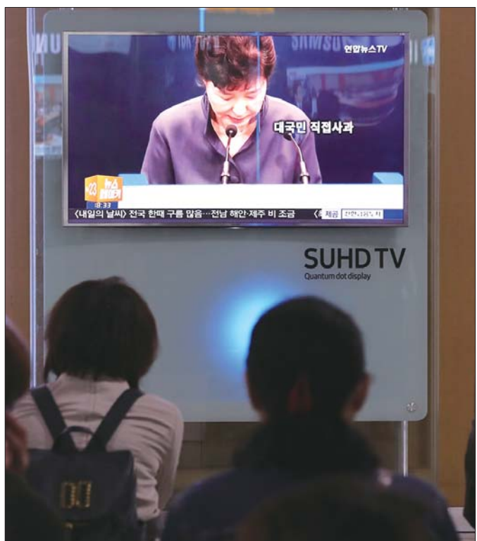
10月25日,在首尔,人们观看朴槿惠发表《致国民书》的新闻。

朴槿惠亲信崔顺实涉嫌“干政”一事在韩国国内遭到媒体猛烈抨击。近日,崔顺实又被爆在朴槿惠对外外交上扮演重要角色。日本媒体担忧,丑闻主角介入日韩外交或将动摇朴槿惠任内对外外交取得的一些进展,尤其可能阻碍去年年末日韩政府就“慰安妇”问题达成和解案的履行。