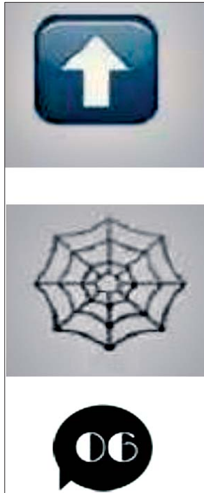
“熊太行”用这三个表情表示“上网喽”。

而微信的用途则是汤涌思考的另一个方面。“微信的工具化，最终会降低它社交和休闲的用途，最终打开