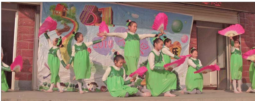
王圈小学文艺汇演。

学按照国家课程计划，完善课程管理，开全课程，开足课时，尤其是认真开设综合学科和综合实践以及地方课程。