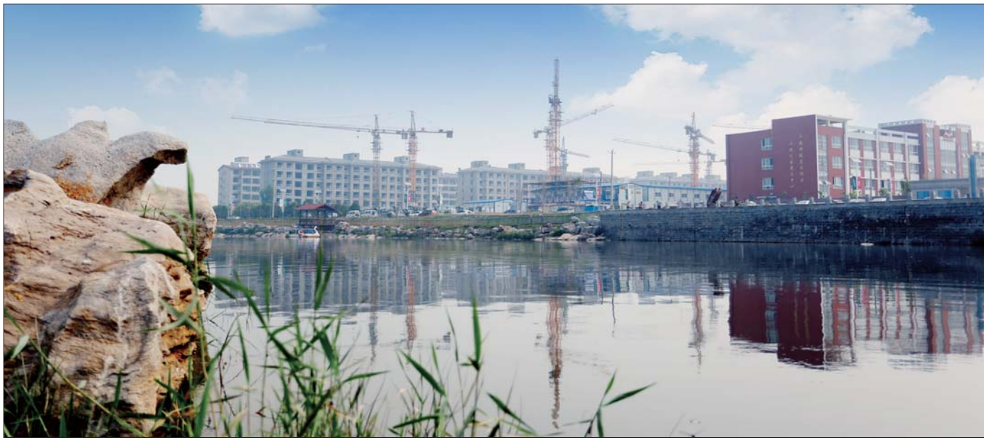
大寺河改造提升工程

今年以来,回河镇坚持“稳中求进”总基调,紧抓“携河发展”“河湖时代”发展新机遇,聚焦招商引资、城镇建设、农业发展、社会民生等重点工作,努力推动全镇经济跨越发展。截至10月底实现全社会固定资产投资15亿元,同比增长25%;规模以上企业生产总值24.5亿元,同比增长8%;规模以上企业利税4.5亿元,同比增长7%。地税完成3320万元,占年计划103.2%;国税完成863.78万元,占年计划83.3%,各项经济指标均实现快速增长。