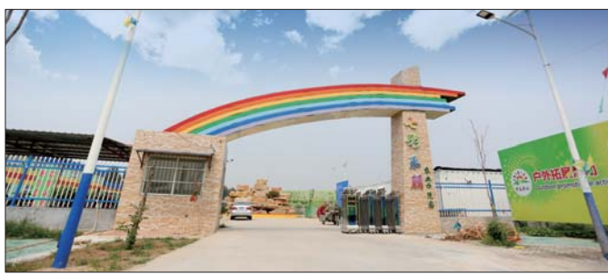
回河镇七彩乐朋农业综合体