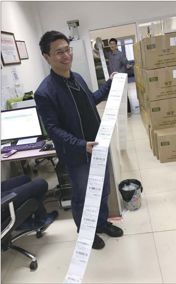
“双十一”之夜，一商家展示发货单，长度惊人。

从各年龄段最喜爱的商品来看，年轻者更喜欢服装，年长者更喜欢酒。小于25岁的烟台消费者最喜欢羽绒服，26-35岁的消费者最喜欢手机，36-40岁的最喜欢羽绒服，而41岁以上的消费者最喜欢葡萄酒。