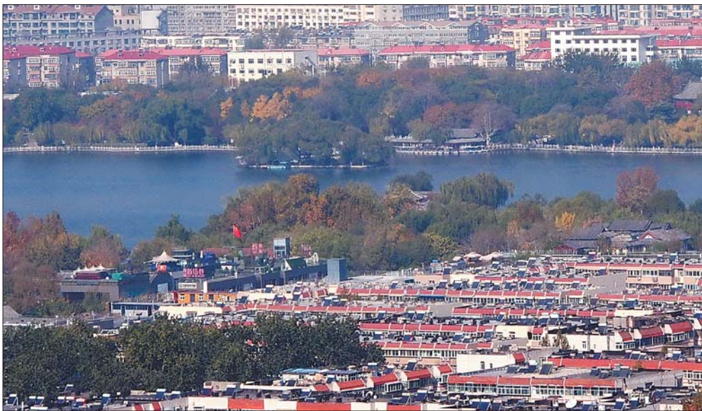
15日的天气还不错,在新一轮雾霾到来之前,省城迎来“喘息”之机。

18~19日小雨转多云,南风转北风都是2~3级,气温略有波动。20~21日受强冷空气影响,有一次降水过程,北风3~4级逐渐增强到4~5级阵风7级,气温明显下降。