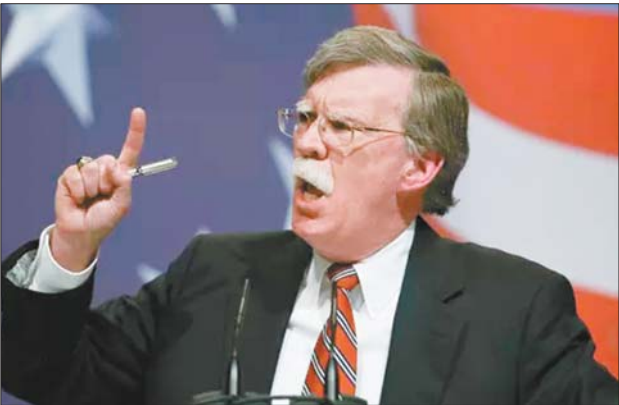
前美国常驻联合国代表博尔顿