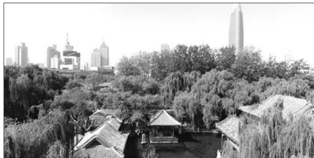
“君子观水”部分获奖作品。