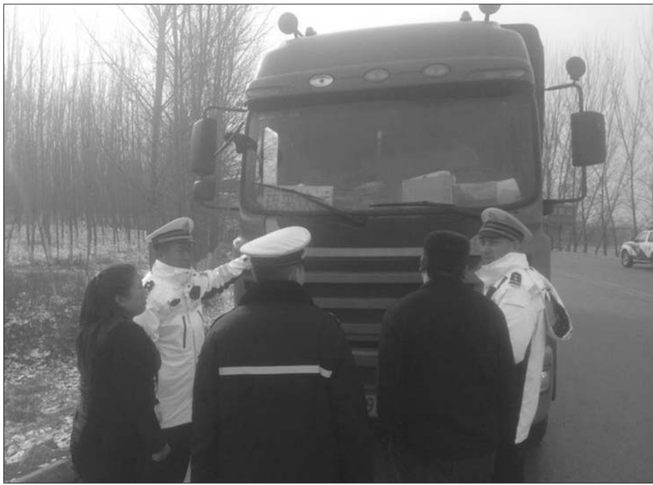
伪装成蔬菜快运的车辆。