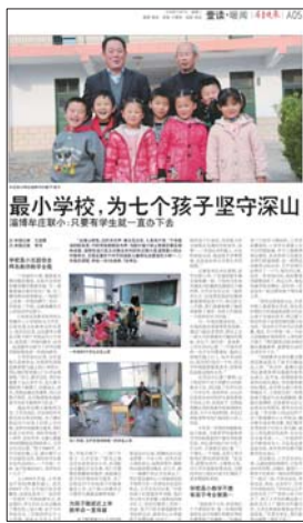
淄博最小学校相关报道。

2名教师,为7个孩子坚守深山,是为了孩子们能够就近入学,这是对教育责任的坚守,更是对孩子们未来希望的坚守。再次来到牟庄联小,孩子们正在吃午饭,一块油饼、一个包子或是一张烧饼就是他们的午餐,与城市里的孩子们相比,没有大鱼大肉、洋快餐。对他们来说,吃饱饭、学好习才有出路,牟庄联小也成为他们学习路上的第一座堡垒。