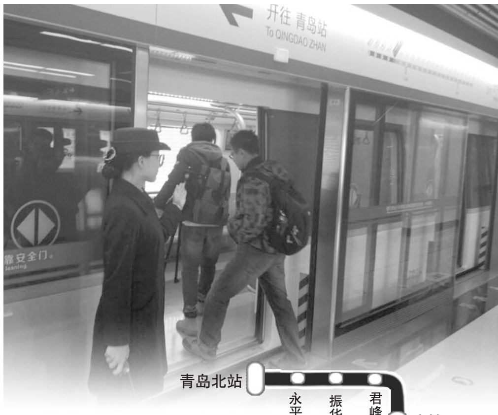
日前,媒体记者试乘青岛地铁3号线。

为了满足市民试乘体验,齐鲁晚报与青岛地铁集团合作免费送出千余张试乘票,欢迎市民领取。免费试乘票还可以通过青岛地铁官方微信“青岛地铁”、“青岛微地铁”及地铁传媒官方微信“地铁新生活”领取。为了解市民试乘感受,收集试乘期间乘客对导向指引、车站环境、人员服务等方面的意见建议,12月7日、8日在青岛站、五四广场站、敦化路站三个站点开展问卷调查,时间为每日上午10:00—11:00;下午3:00—4:00。通过分析问卷中市民的意见建议以及服务诉求,进一步提高青岛地铁的服务水平。