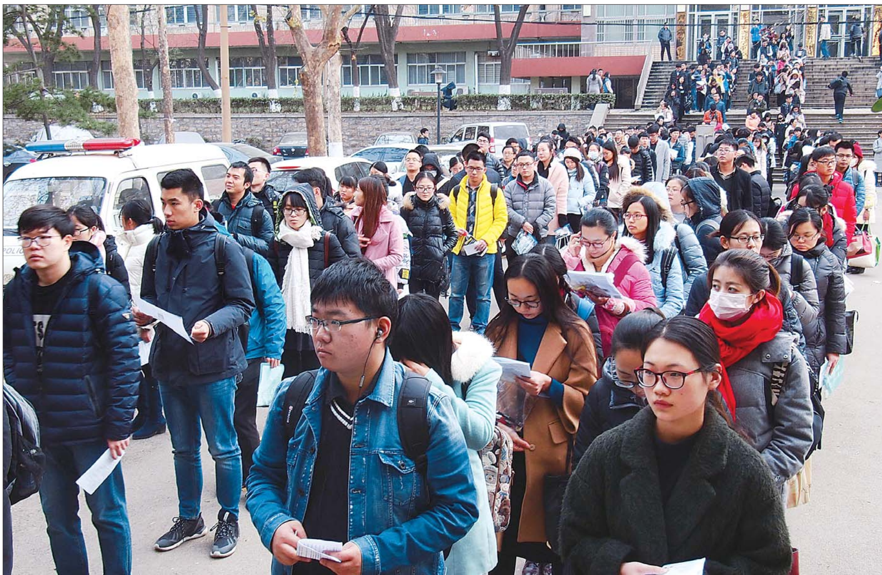
27日,2017年国家公务员考试拉开序幕,当天进行了笔试。今年有148万余人通过资格审查,为近三年最高。图为济南山东师大考场,考生排队入场。