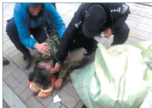
巡警救助醉酒女子。

酒气。根据路边群众的描述,该女子在步行至此处时不知道什么原因突然晕倒在地。 为了防止意外发生,民警立即采取现场急救措施,首先抱住该女子的头部,让呕吐物顺畅流出,用卫生纸将其呕吐物擦干净,然后为其准备了矿泉水喂服。与此同时,民警拨打120急救电话。随后,急诊医生及时赶到,对该女子进行检查,确认其无生命危险。 路经此处的一位市民认识该女子,立即与女子的家人取得联系。很快,女子的家人接到电话后也赶到现场。民警和女子的家人将该女子抬上救护车到院做进一步检查。待救助结束之后,民警再次驾车进行正常的巡逻。