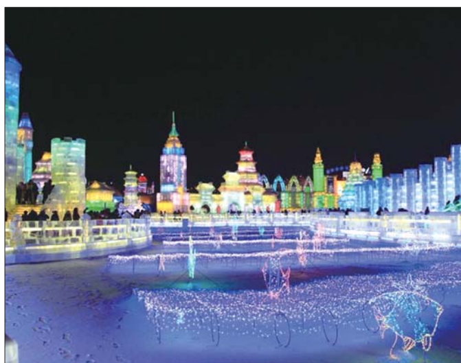
哈尔滨冰雪大世界

准备,山峦与树木银装素裹,瀑布与湖泊冰清玉洁,蓝色湖面的冰层在日出日落的温差中,变换着奇妙的花纹。